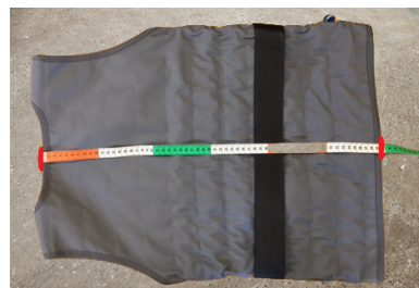
Mål af længde.