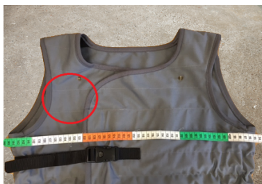
Største mål. Ingen af velcrobåndene er synlige.