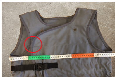
Mindste mål. Ingen overlappning af sømmene.